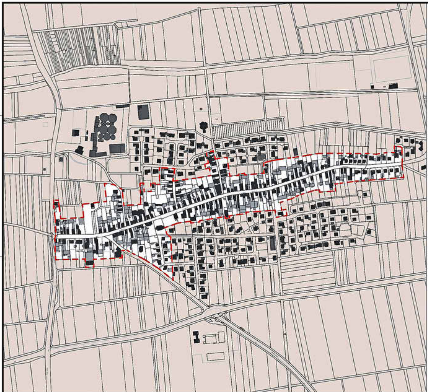
Satzung der Ortsgemeinde Freimersheim zur förmlichen Festlegung des städtebaulichen Sanierungsgebietes „Sanierungsgebiet – Ortskern Freimersheim“