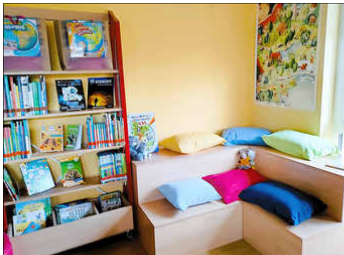
Die neue Wissensecke mit Lesetreppe.

Das Veranstaltungsprogramm war vielfältig: Zwei Abendlesen, die Brett- und Rollenspiel-Con, die erfolgreiche Teilnahme am Vor- und Lesesommer mit einer gemeinsamen Abschlussveranstaltung der BiG-Büchereien, das Adventsfenster mit Stabtheater sowie Präsenz an der Kerwe und dem Adventsmarkt. Über 600 Besucher besuchten die verschiedenen Veranstaltungen.