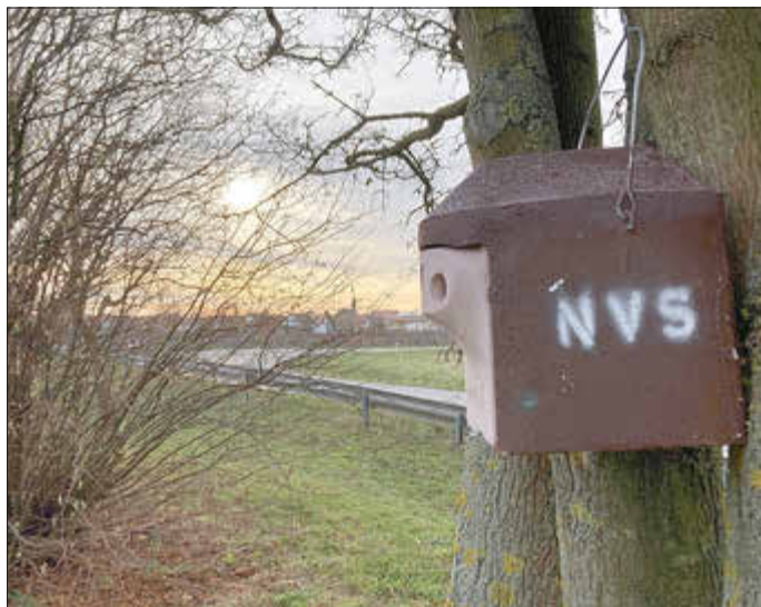
Nistkasten für Höhlenbrüter