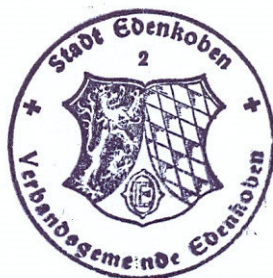
Ludwig Lintz Stadtbürgermeister