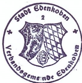
Ludwig Lintz Stadtbürgermeister